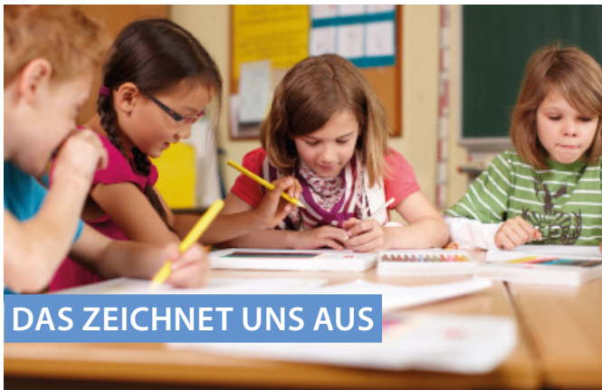
DAS ZEICHNET UNS AUS