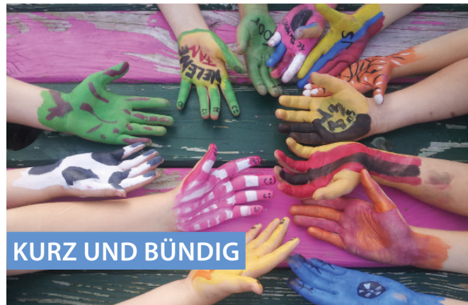
KURZ UND BÜNDIG